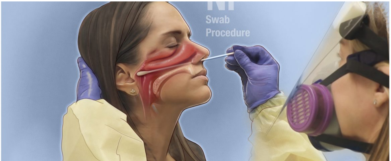
Foto 2.: COVID testovanie, Zdroj: https://medicalart.johnshopkins.edu/covid-19/